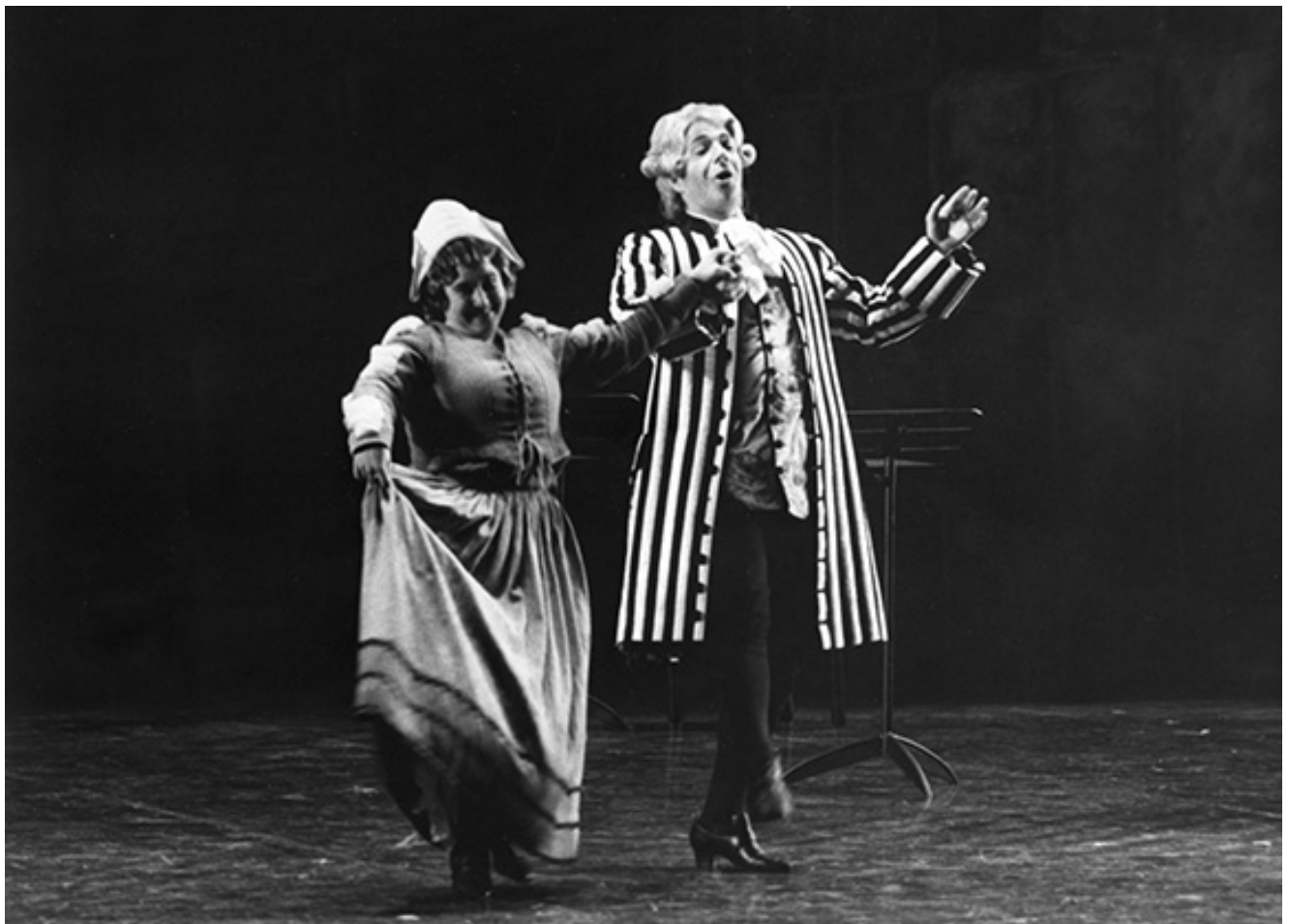
Berta ne Il barbiere di Siviglia - Pisa