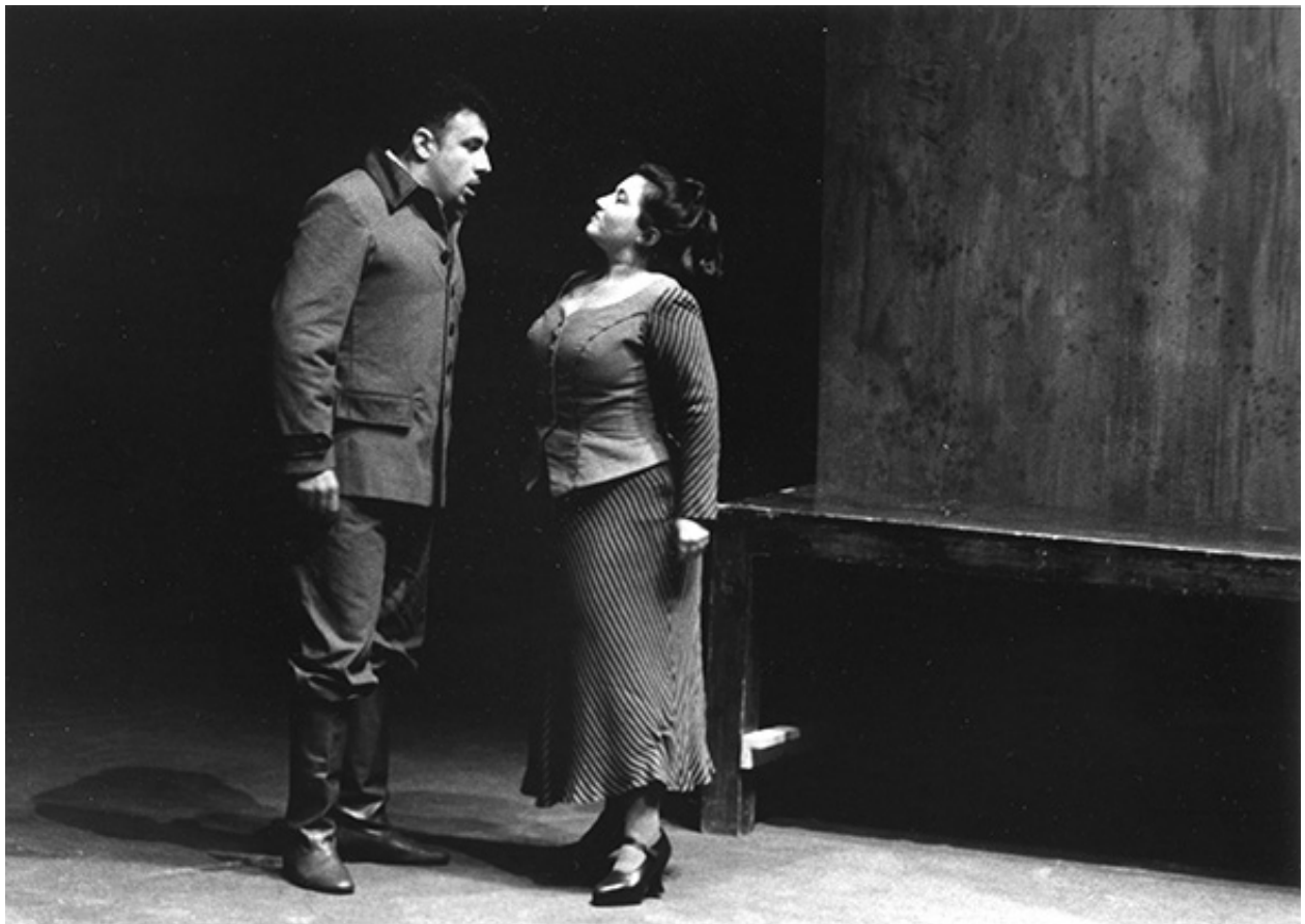
Marzeline in Fidelio - Teatro di Pisa