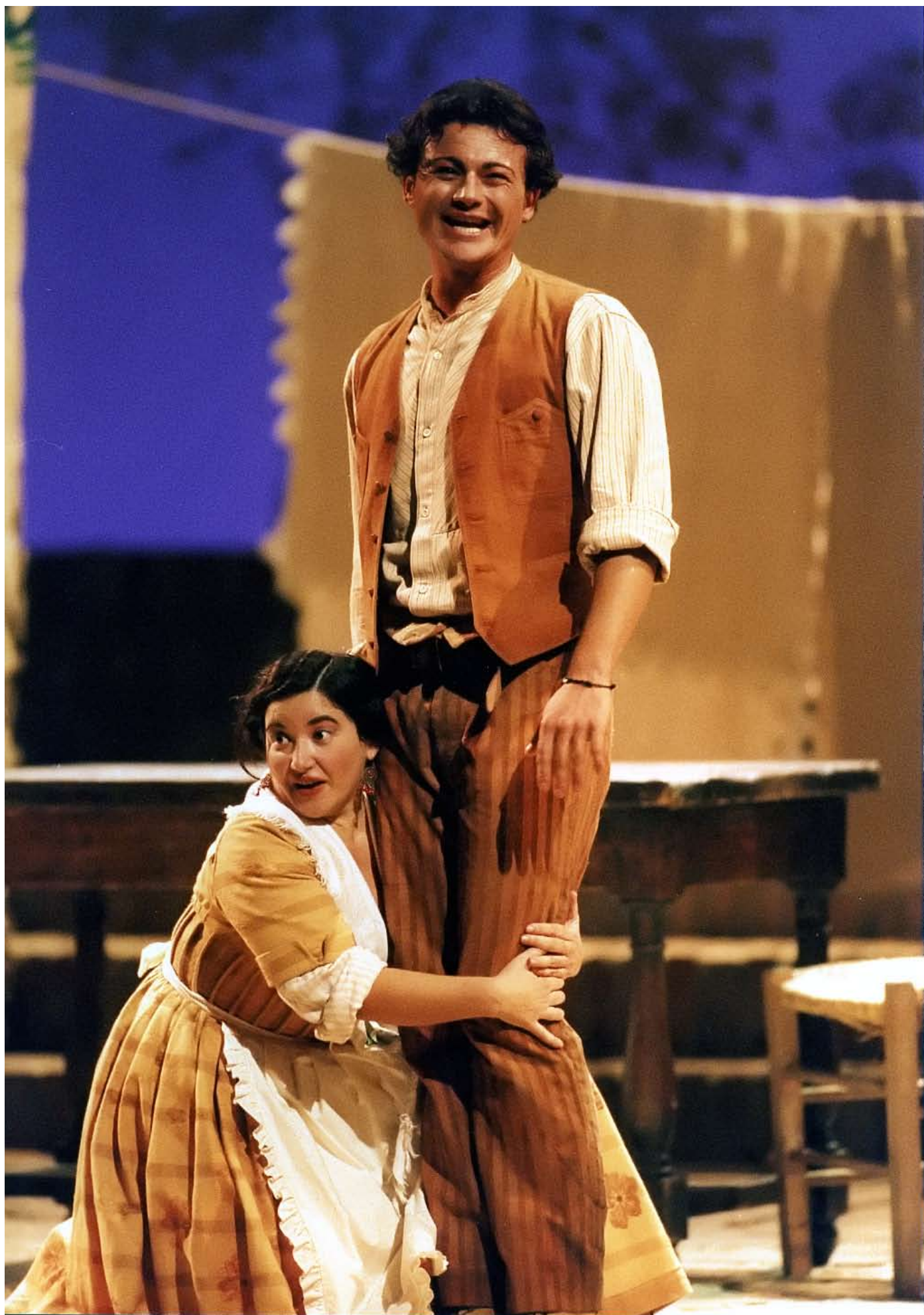
Con Vittorio Grigolo - L'Elisir d'amore - Teatro dell'Opera di Roma