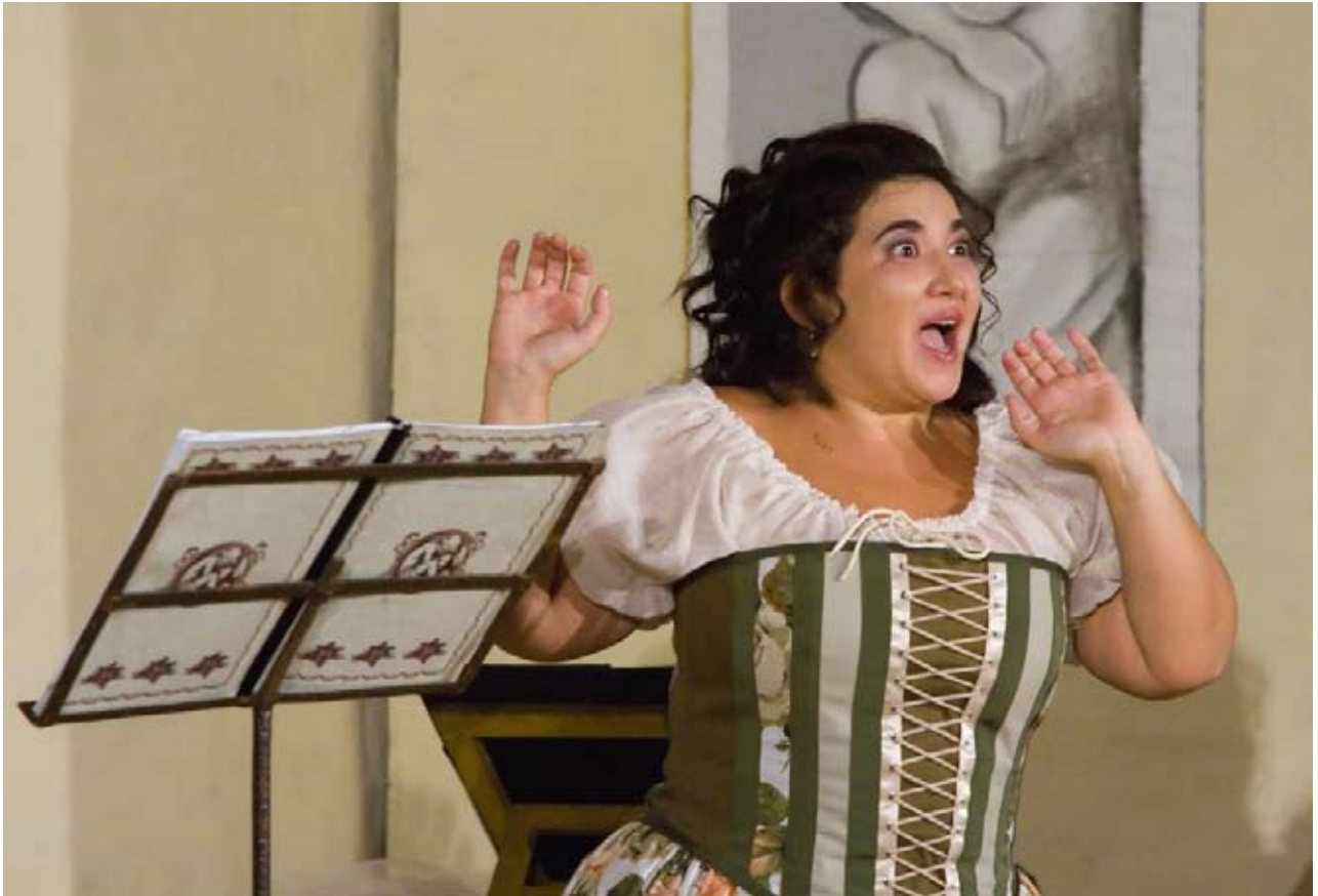
Festival dell'opera buffa-Lauretta ne "Il maestro di Musica" di Pergolesi